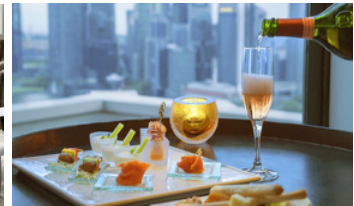
晚間雞尾酒及開胃點心 (晚上6:00至8:00)