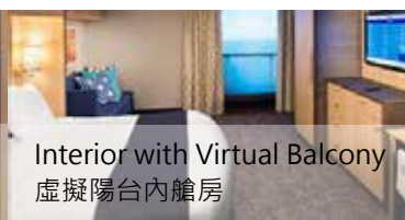
Interior with Virtual Balcony 虛擬陽台內艙房