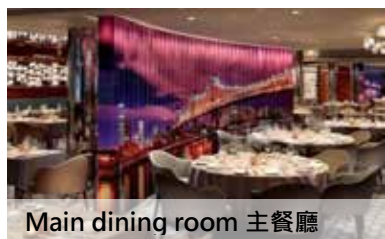
Main dining room 主餐廳