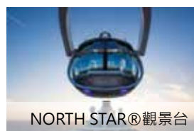
NORTH STAR® 觀景台