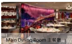
Main Dining Room 主餐廳