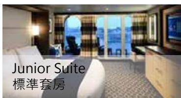
Junior Suite 標準套房