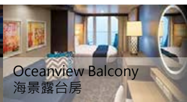
Oceanview Balcony 海景露台房