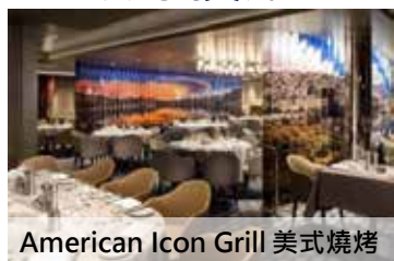
American Icon Grill 美式燒烤