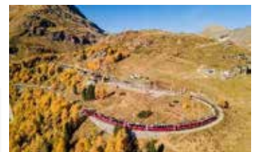
Bernina Express 伯爾尼納快車