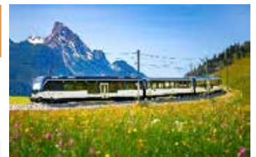
黃金列車 GoldenPass Panoramic