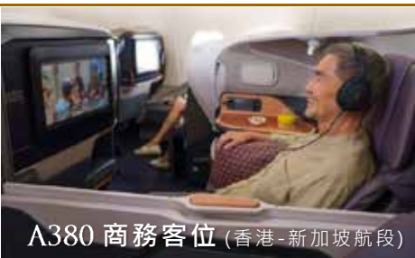
A380 商務客位 (香港 - 新加坡航段)

Parkroyal Collection Marina Bay 星級之選 以 Garden-In-A-Hotel 為概念 · 耗資 4500 萬新元翻新 · 由 John Portman 傾心打造 · 設有 Sky-Bridge、13 米高植物牆