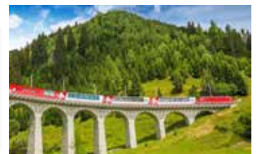
Glacier Express 冰河快車