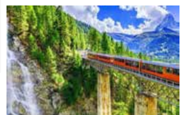
Gornergrat 高納葛拉特齒軌火車